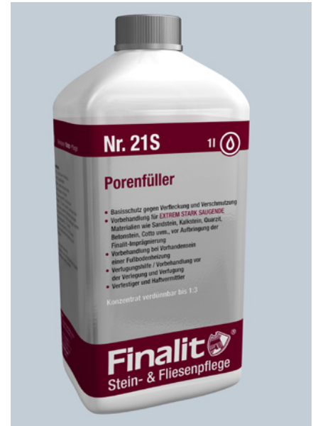
Finalit 21 S Porenfüller.

(Versuch mit Rotwein) gegenüber unbehandelten Natursteinen. Die Prüfer kamen zu dem Ergebnis, dass die Wasseraufnahme durch die Vorbehandlung stark herabgesetzt wird, die beiden Produkte (Porenfüller und Imprägnierung) durch ihre Wasserdampfdurchlässigkeit als Imprägnierung für Natursteine bestens geeignet sind und dass Rotwein auf den behandelten Natursteinen wie einem stark saugenden Sandstein keine Flecken hinterlässt. „Unser Porenfüller ist ein guter Verfestiger mit dem wir z.B. auch die Kalksteine der Sakkarapyramide in Ägypten, die Sphinx und viele weitere Denkmäler mit Zustimmung der Denkmalschutzbehörden erfolgreich behandelt haben. Unser Ziel ist es alle Weltkulturerbe Stätten zu behandeln und den Denkmalpflegern die Qualitätsprodukte von Finalit zugänglich zu machen“, sagt Margit Leidinger. Grundlage des Sortiments sind die in jahrzehntelanger Steinmetz-Erfahrung von Finalit selbst entwickelten Profiprodukte,