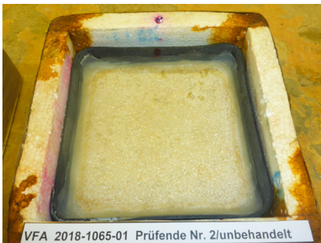
Prüfende Platte Nr. 2 unbehandelt, Abwitterungsmenge 16 \text{ g/m}^2 .

am Prüfungsende eine Materialabwitterung von 16 \text{ g/m}^2 . Die mit dem farblosen Finalit Nr. 21S Porenfüller behandelten Platten hatten nur eine Abwitterung von 8 \text{ g/m}^2 also gerade mal die Hälfte. Alle unsere Produkte zur Reinigung, Pflege und Schutz von Natursteinen und keramischen Belagsmaterialien wurden von uns selbst entwickelt, stammen aus eigener Produktion und